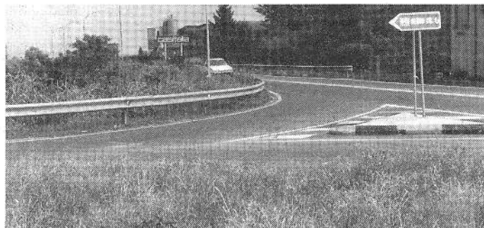
L'erba alta che 'nasconde' l'incrocio