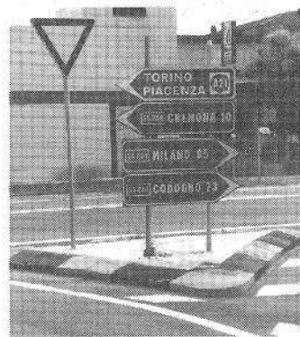
I cartelli bassi all'incrocio